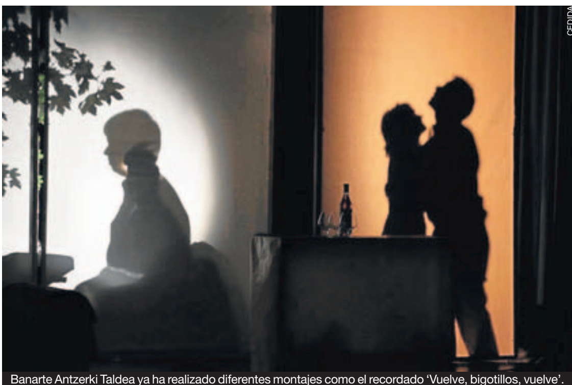
Banarte Antzerki Taldea ya ha realizado diferentes montajes como el recordado 'Vuelve, bigotillos, vuelve'.

"Poco más se puede decir ya de esta banda que no deja de escucharse. Sus estribillos peligrosamente pegadizos y esa esencia pop-rockera vasca hacen de este un grupo digno de la fama que están logrando en los últimos tiempos".