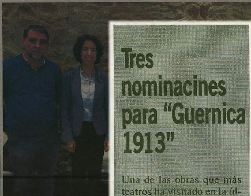
Momento de la presentación el pasado miércoles

Todo listo para que la plaza de santa Ana se traslade al Jerusalén de hace 2000 años con el propósito de conmemorar la muerte y resurrección de Cristo. Y es que por vigésima segunda vez consecutiva, la Asociación Juan de Iciar organiza La Pasión de Durango con tres pases que tendrán lugar los días 1, 2 y 3 de abril, funciones que comenzarán a las 21.00 horas y contarán con una duración aproximada de dos horas y cuarto.