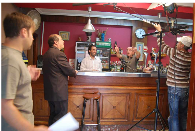
Grabación del cortometraje "El préstamo"

Desde su nacimiento, en diciembre de 2007, mantiene una actividad importante organizando numerosas acciones, entre las que destacan las formativas, no solo para los miembros de la compañía, sino que también abiertas a la ciudadanía.